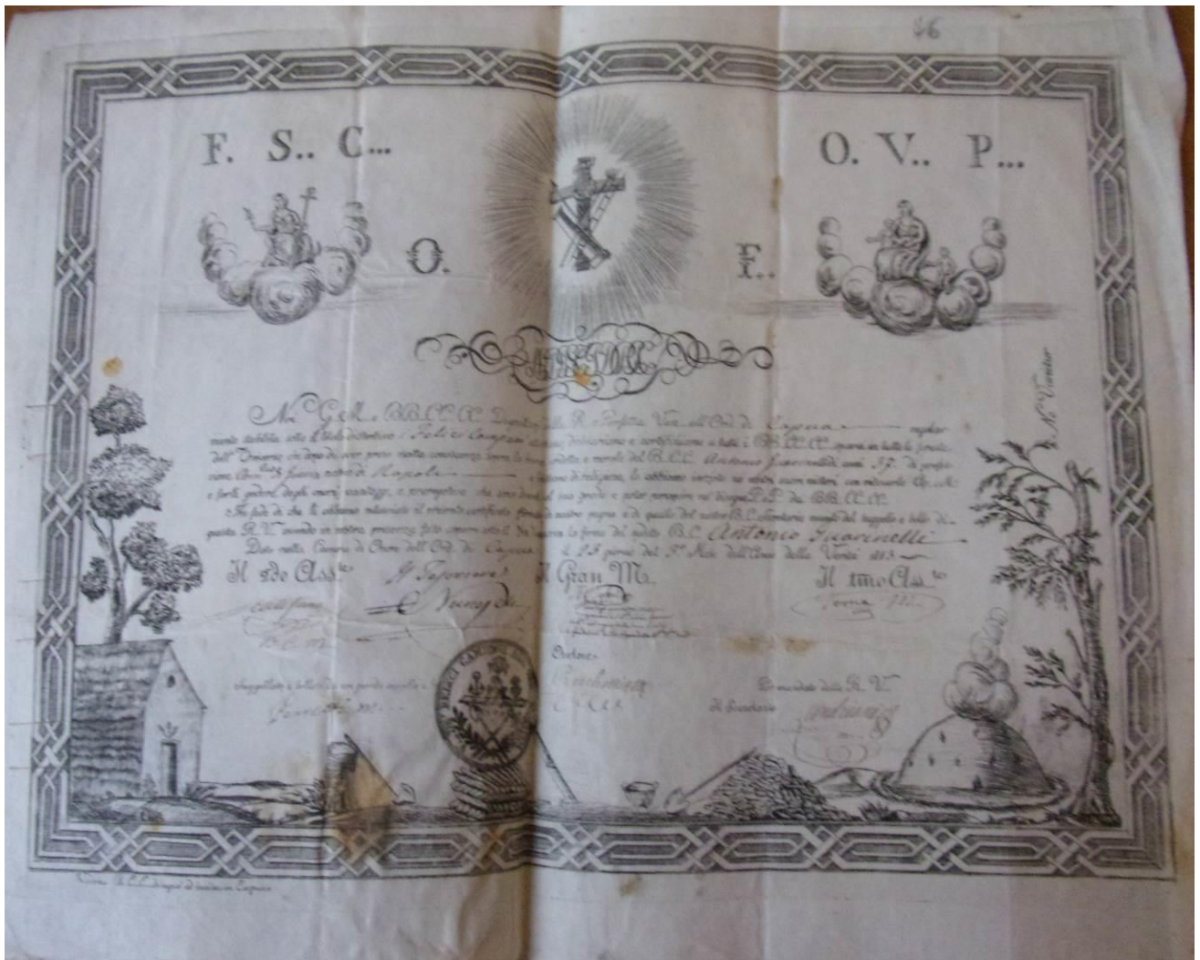
Figura 3. Diploma carbonaro di Capua, ASNA, Archivio Borbone, b. 723.

appartenevano, anzi lodare.» Questa decisione fu sostenuta ed appoggiata dal detto penitenziere Vastano, ritenuto «massone antico e carbonaro notissimo per le sue scelleraggini.»