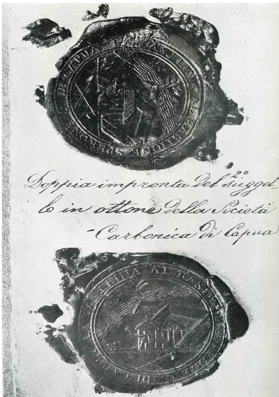
Figura 2. Doppia impronta del 2° suggello in ottone della Società Carbonica di Capua, Capua, proprietà Garofano.

Il redattore, probabilmente un ecclesiastico o un personaggio molto vicino a tale ambiente, afferma: