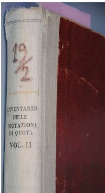
Figura 7. ASCE, Inventario Mutazioni di Quota, armadio inventari vol 2.

Altre mutazioni le troviamo nei documenti versati dall'Intendenza di Finanza ma si riferiscono solo ai fascicoli relativi ai beni soggetti a bonificazione (per gli anni dal 1850 al 1859). Nonostante l'annotazione relativa alle mutazioni (o volte) si legga in tutti i volumi del catasto anche dopo l'Unità d'Italia, purtroppo, dopo l'anno 1865 non abbiamo più la possibilità di